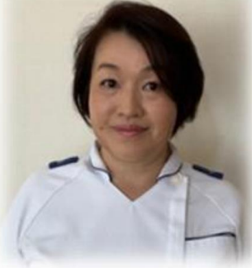
感染対策チーム 院内ラウンド

(Professional Nurse for Infection Prevention and Control /PNIPC)