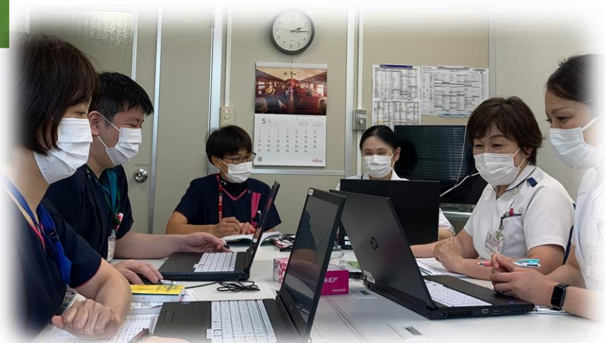
抗菌薬適正使用支援チーム